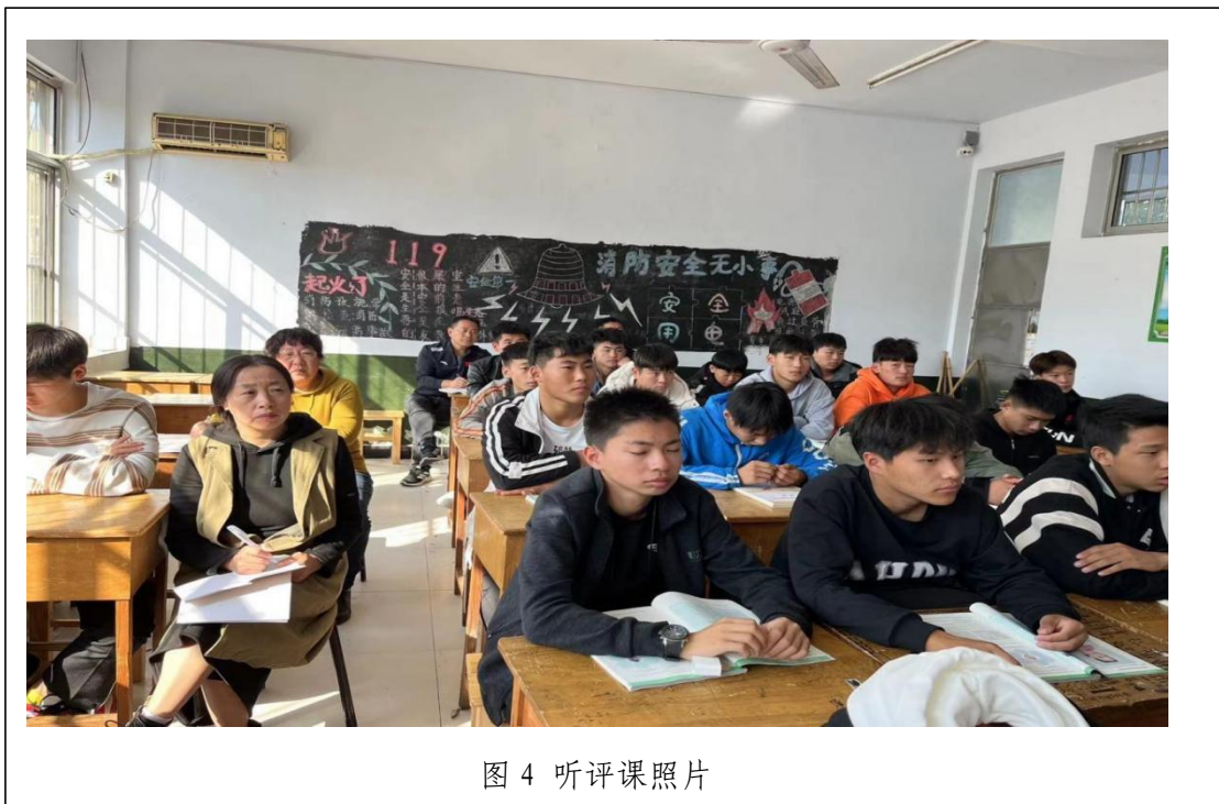
图 4 听评课照片

在课堂教学中，学校教师致力于改变传统的讲授法、问答法，从学生所关注的兴趣点入手，课堂以故事、音乐或游戏活动等方式开展教学。根据体育生特点，给予简单而有趣的奖励，从而避免部分学生“隐性逃课”。同时，教师在教学设计中逐步利用“最近发展区”，满足学生求知欲，避免学生害怕失败的动机形成，增强其自信心，以促使学生形成持久的学习动机。此外，教师也在尝试改变传统的评价方式，由绝对改为相对评价，学生之间的横向比较减少，每个学生的纵向比较增多，努力激发和培养学生的学习动机设法消除他们的无助感，鼓励学生学习。