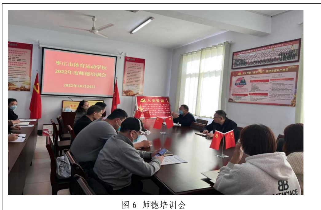
图 6 师德培训会

和山东省教育厅互联网+教师专业发展两项培训的基础上，还积极组织教师参加了 2022 年度职业教育工作调度推进视频会和国家职业教育智慧教育平台应用推广网络等各级各类培训。在日常教学工作中，充分发挥听评课、集体备课等活动平台的作用，鼓励教师们各抒己见、发挥专长。通过积极发动、定期督促、及时总结等方式，各项培训活动有序进行，帮助教师不断更新教育教学理念，有效促进了教师队伍整体能力和水平的提高，为学校的改革和发展奠定坚实的基础。