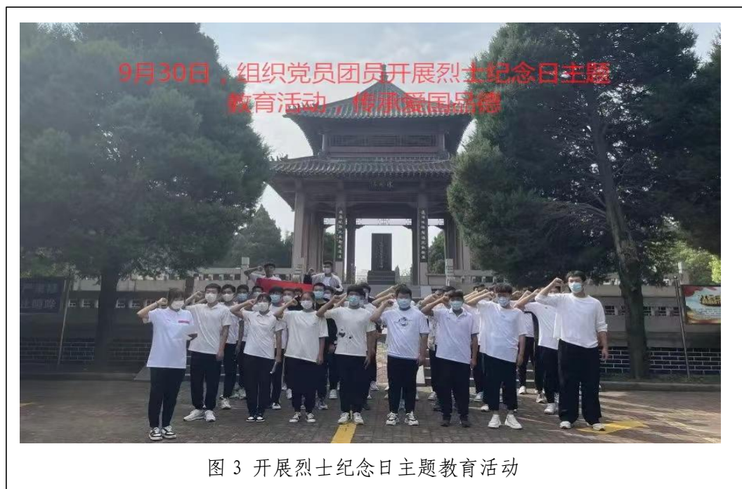
图3 开展烈士纪念日主题教育活动

大力营造社会主义核心价值观建设氛围。为了让社会主义核心价值观深入人心，学校支部加大了宣传力度：在校园内显眼处安装了宣传栏。深入宣传我校培育和践行社会主义核心价值观的建设成果，展示社会主义核心价值观建设中的经验以及先进人物，营造推进社会主义核心价值观建设的良好氛围，进一步加强校园精神环境建设，营造健康向上、积极进取的精神氛围。通过举办一次知识讲座、组织一次主题班会活动、主办一期主题黑板报、观看一部革命题材的影片等形式向学生渗透核心价值观的内容，将社会主义核心价值观与行为习惯培养结合起来，倡议学生做一个有道德的人，在全校形成了人人懂文明、人人讲文明、人人践行文明的良好格局。