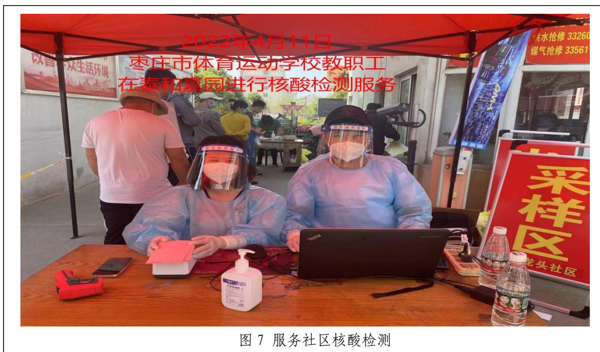
图 7 服务社区核酸检测

疫情期间，组织党员干部赴“双报到”社区组织开展疫情防控志愿服务活动，组织党员干部深入滕州市部分乡镇、村居协助开展疫情防控，让党旗在战“疫”第一线高高飘扬。组建新时代文明实践队伍，通过打扫社区卫生、发放宣传单页等形式开展“助力创城 志愿有我”系列志愿服务活动。