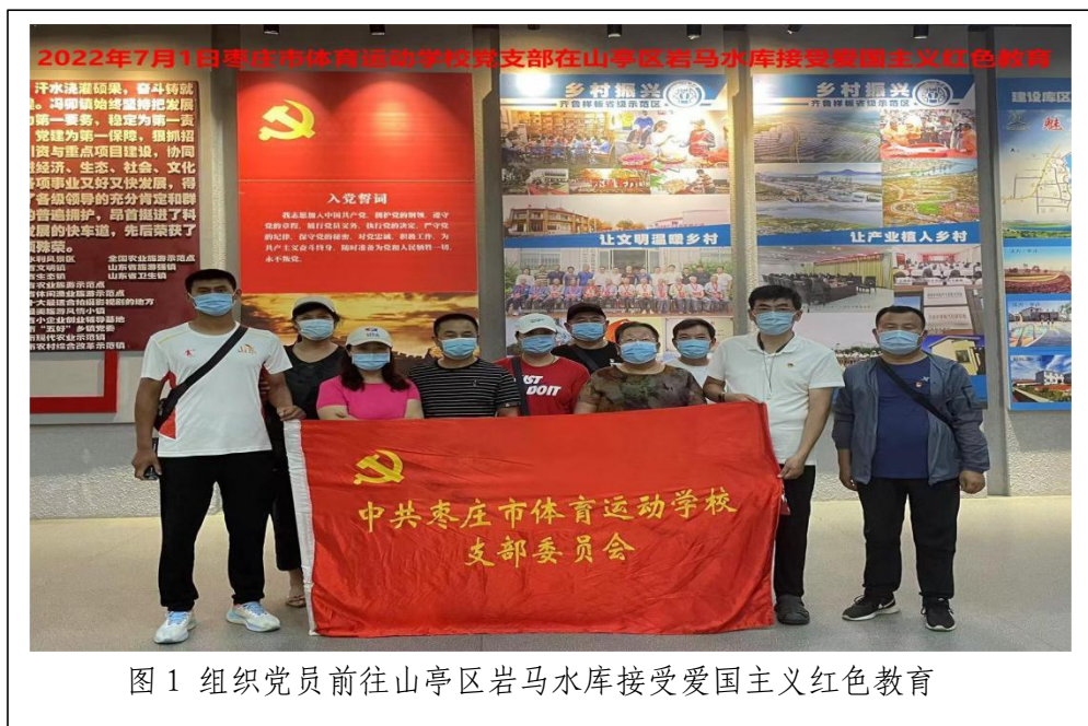
图 1 组织党员前往山亭区岩马水库接受爱国主义红色教育

学校党支部将“围绕中心抓党建，抓好党建促发展”贯穿于工作之中。研究制定学校 2022 年党建工作计划，并将党建工作纳入目标考核，与每个党员签订党风廉政目标责任书，把党建工作落实到学校日常管理中，促进了教学、训练质量的提升。充分挖掘每一个党员主观能动性，调动每一位党员扎根在训练教学第一线。目前学校共有 33 名正式党员，一位位优秀的党员，就像一面面鲜红的旗帜。积极进取的精神传承，有声有色的支部活动，更是吸引着越来越多的优秀青年教职工加入党的组织。