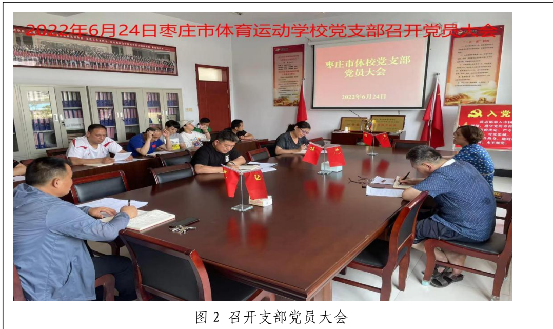
图 2 召开支部党员大会

级指示，精选学习内容，提炼学习要点，精简发言稿，保证实效，决不搞形式、走过场。而且内容丰富、突出重点，紧扣形式，注重实效，真正做到了党员活动促进党建发展。并且把党课对象扩大到全体师生，深受师生欢迎，取得了很好的效果。