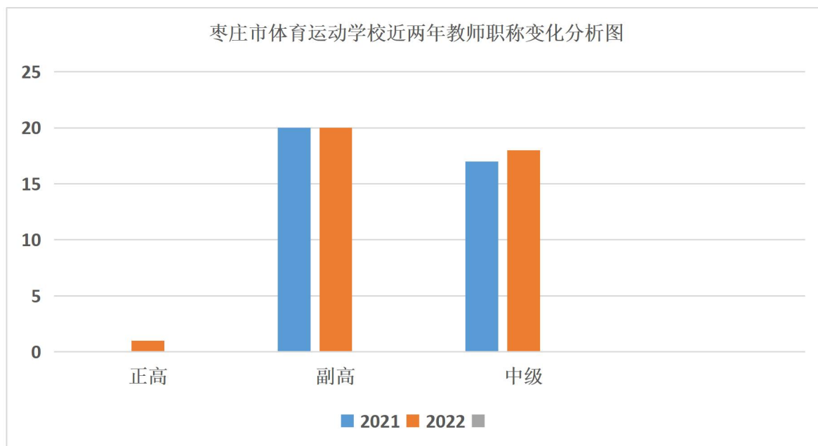
表 5 学校近两年教师职称变化分析图