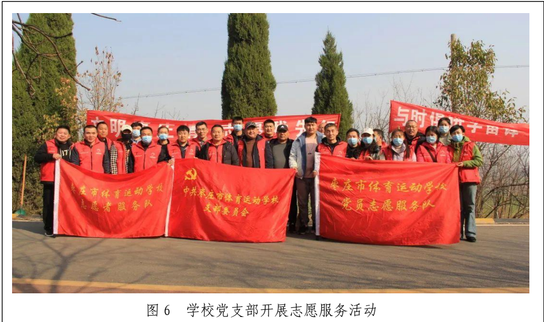
图 6 学校党支部开展志愿服务活动

组建新时代文明实践队伍，利用传统节日及时间节点，通过打扫社区卫生、发放宣传单页等形式开展“助力创城 志愿有我”系列志愿服务活动，为枣庄文明城市建设贡献了体育力量。