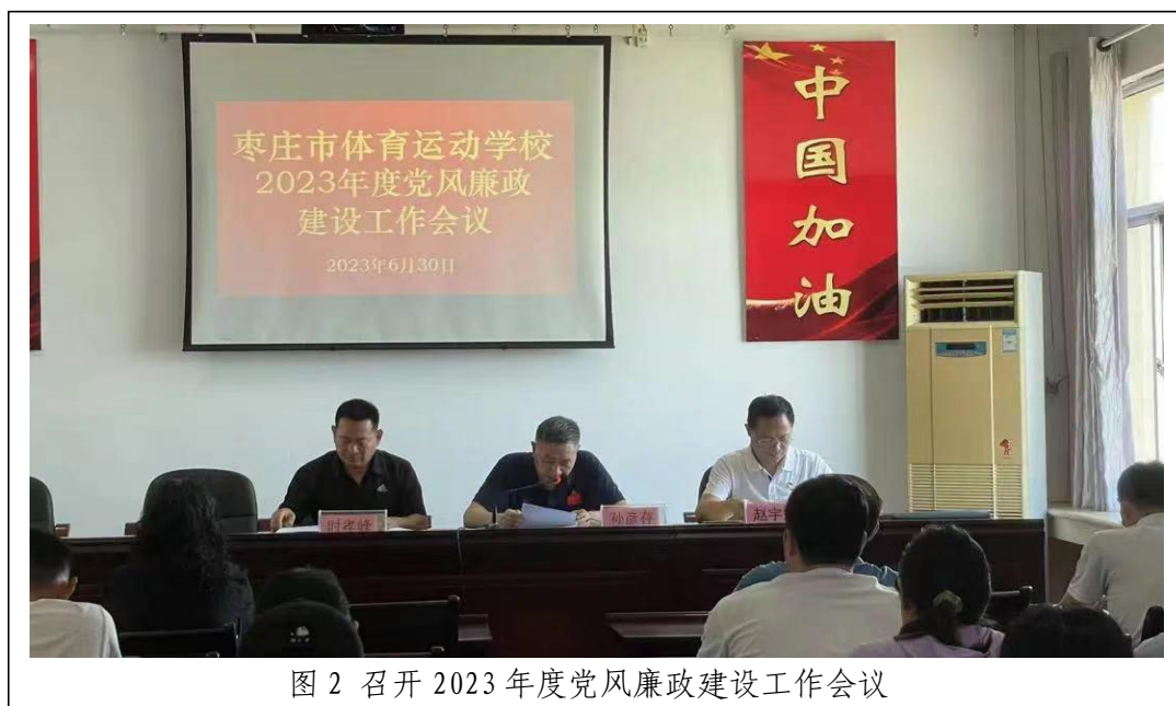
图2 召开2023年度党风廉政建设工作会议

各项工作中，坚持把学习作为首要任务，强化重要讲话学习教育，引导支部党员严格遵守纪律和规矩。二是锚定严肃生活不放松。严格按照红脸出汗、咬耳扯袖基调严肃开好组织生活会，严肃开展批评与自我批评；持续规范开展“三会一课”、谈心谈话等；严密组织支部主题党日活动，增强党支部能力，落实管理责任。学校党支部目前共开展了14次主题党日活动、12次政治理论学习活动、15次支委会、6次党员大会、4次党课。