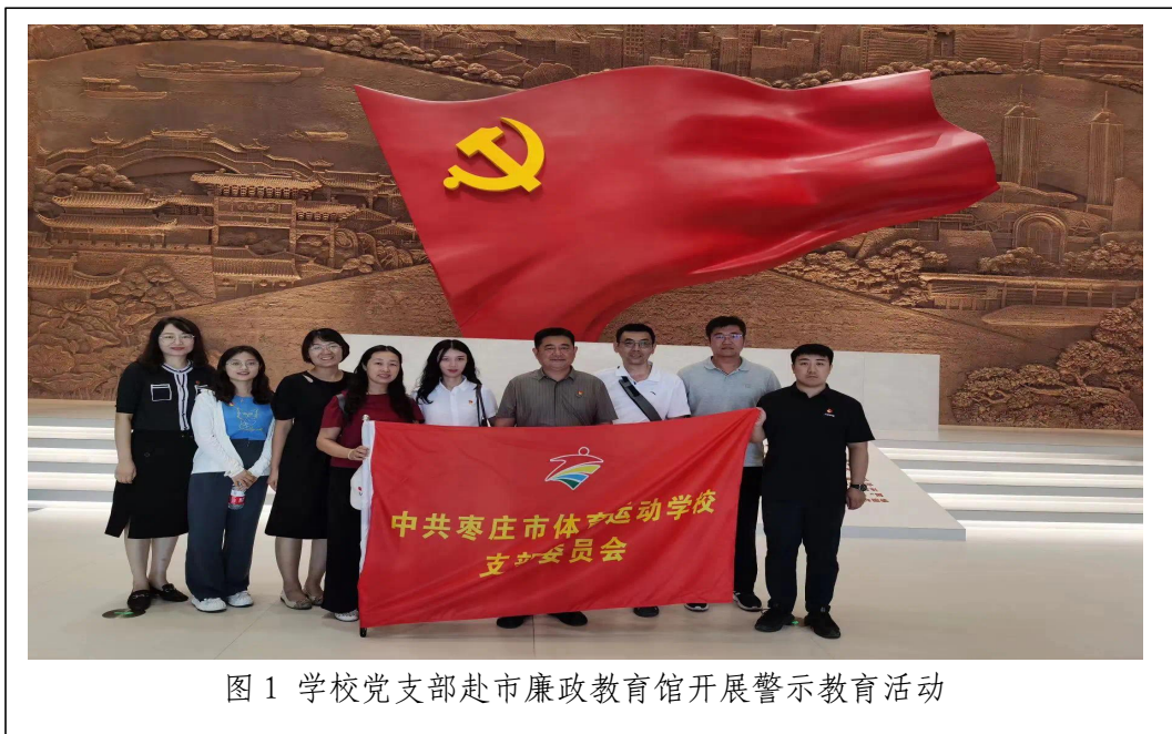
图 1 学校党支部赴市廉政教育馆开展警示教育活动

学校党支部将“围绕中心抓党建，抓好党建促发展”贯穿于工作之中。研究制定学校 2023 年党建工作计划，并将党建工作纳入目标考核，与每个党员签订党风廉政目标责任书，把党建工作落实到学校日常管理工作中，促进了教学、训练质量的提升。充分挖掘每一个党员主观能动性，调动每一位党员扎根在训练教学第一线。目前学校党支部共有 34 名正式党员，两名预备党员，一位位优秀的党员，就像一面面鲜红的旗帜。积极进取的精神传承，有声有色的支部活动，吸引着越来越多的优秀青年教职工加入党的组织。