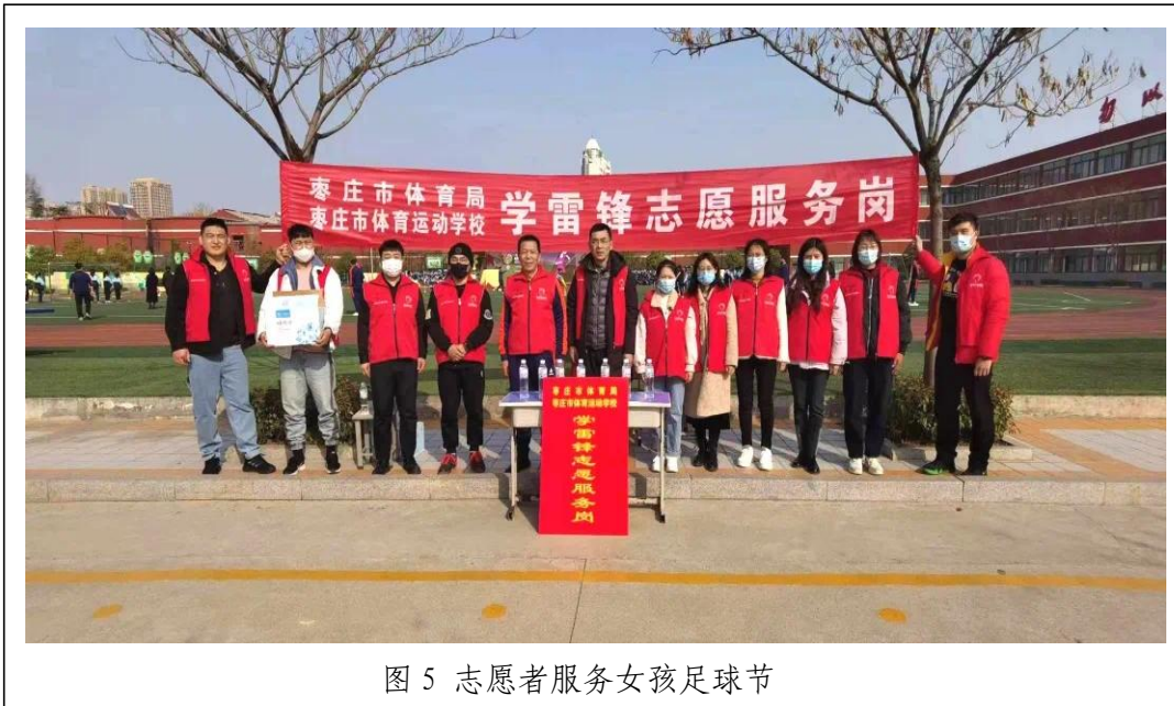
图 5 志愿者服务女孩足球节

为贯彻落实习近平总书记关于深入开展学雷锋活动精神作出的重要指示，深刻把握雷锋精神的时代内涵，3月3日，市体校青年理论学习小组成立志愿服务队，来到了市中区逸夫小学西校区，为女孩足球节提供志愿服务。